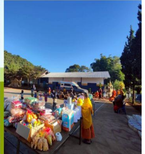
จัดกิจกรรมวันเด็ก ณ โรงเรียนบ้านขุนแม่นาง อ.แม่แจ่ม จ.เชียงใหม่