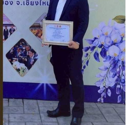
เนื่องในโอกาสรับเกียรติบัตร ศึกษานิเทศก์ “ดีเด่น” ประจำปีการศึกษา ๒๕๖๑