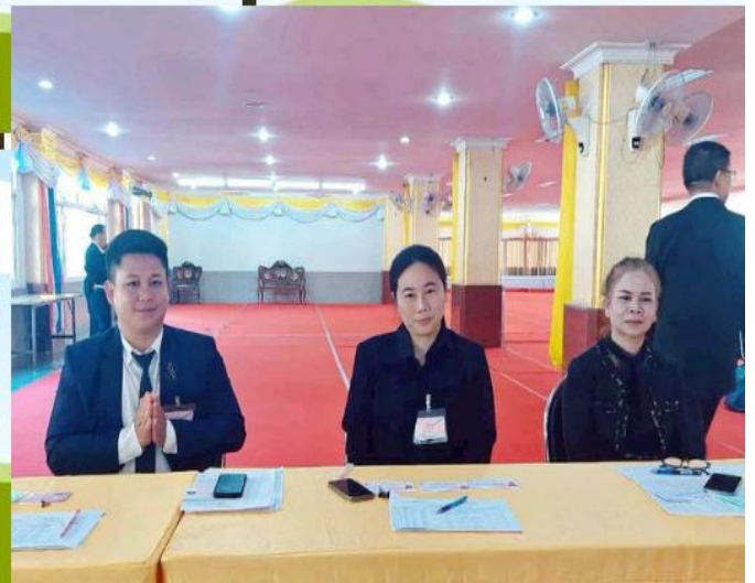
เป็นเจ้าหน้าที่ลงทะเบียน การสอบคัดเลือกเพื่อบรรจุ เป็นเจ้าหน้าที่การศึกษาพระปริยัติธรรม แผนกสามัญ ศูนย์สอบจังหวัดเชียงใหม่