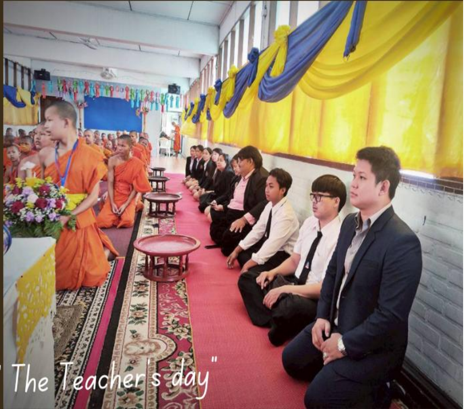
"The Teacher's day"